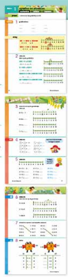
De handleiding geeft informatie om de instructie te realiseren

8 Optellen tot en met 10. Stipcomen. Reken in de tweede rij uit wat het startgetal is.